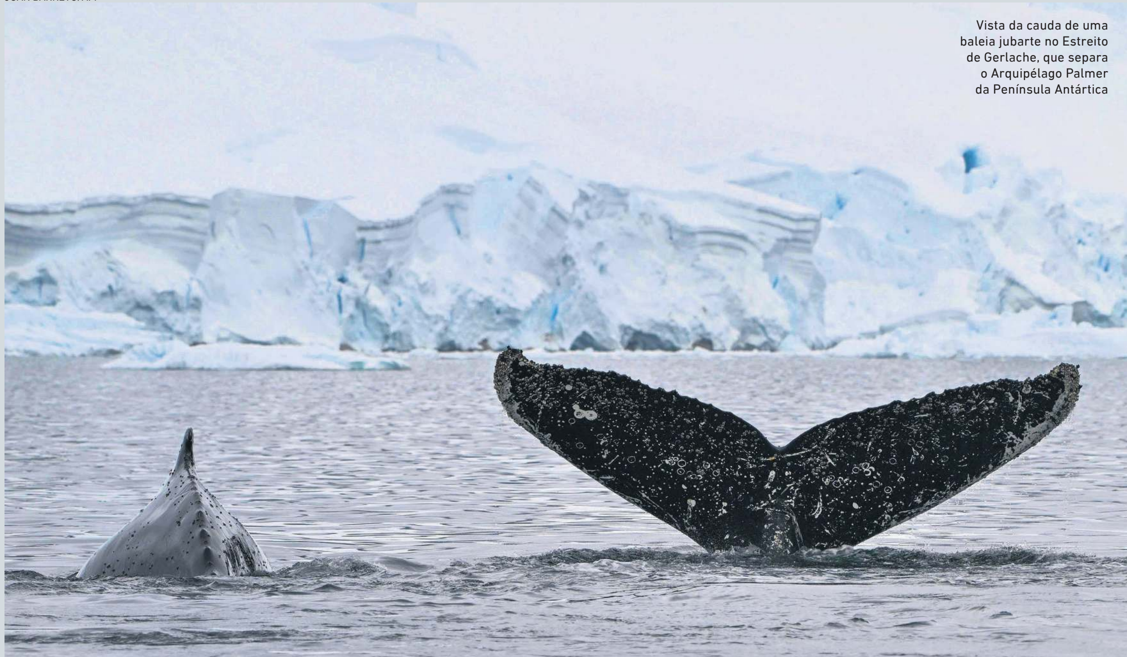
Vista da cauda de uma baleia jubarte no Estreito de Gerlache, que separa o Arquipélago Palmer da Península Antártica

| ESTUDOS | Fato de um ou outro cientista pensar diferente transmite ideia de divisão na comunidade científica, que não existe