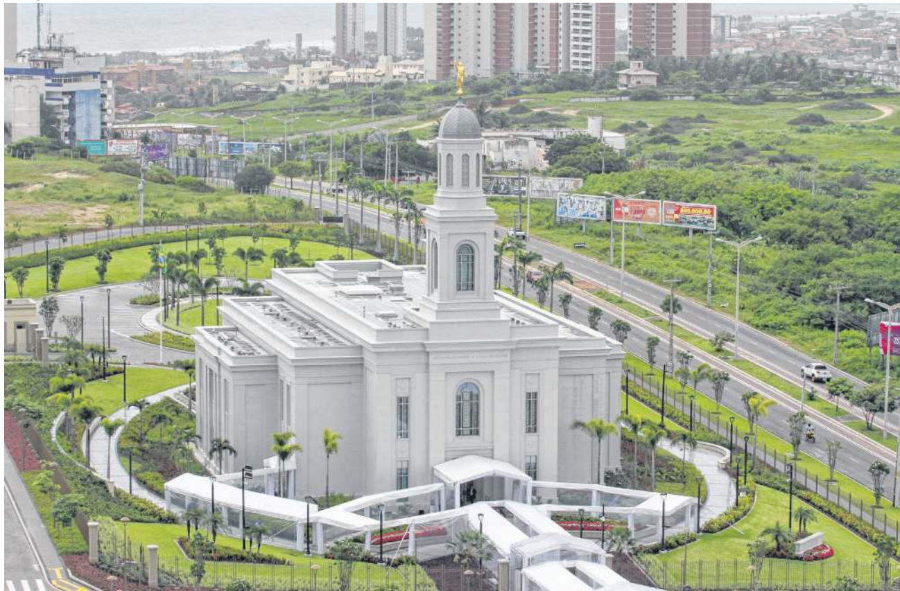
TEMPLO da Igreja de Jesus Cristo dos Santos dos Últimos Dias