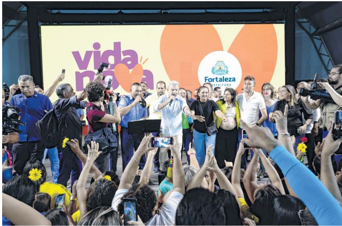
SOLENIIDADE ocorreu no Parque Rachel de Queiroz

totalizando R$ 750 milhões. Na sequência, vem a construção de 25 novas escolas, cuja previsão é de empregar R$ 335,9 milhões em recursos, e pela requalificação de 91 unidades de ensino, com orçamento estimado em R$ 171,7 milhões.