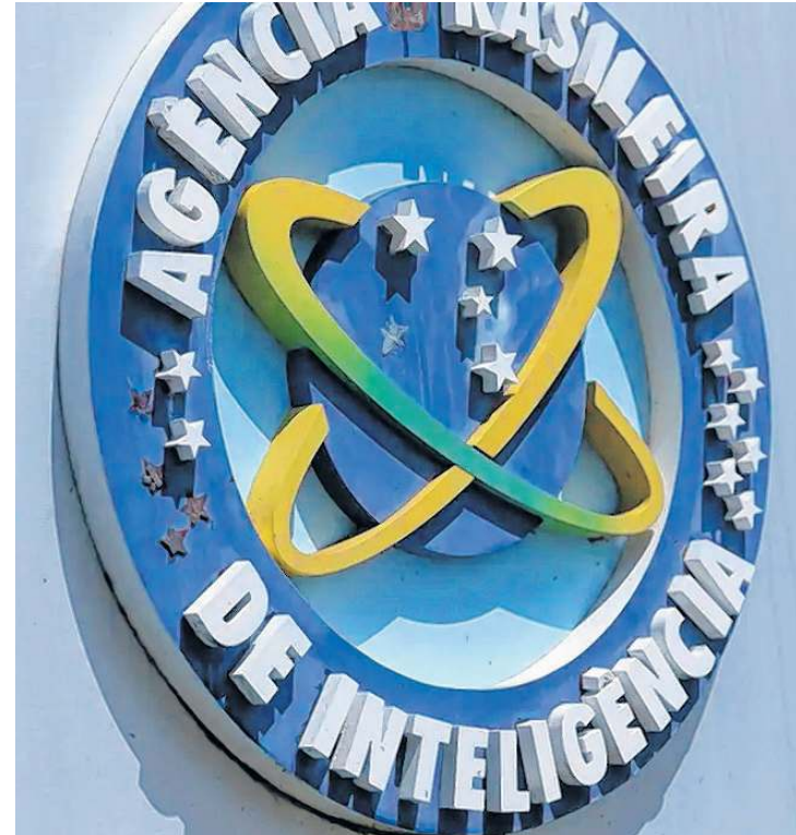
AGÊNCIA Brasileira de Inteligência (Abin) é alvo de investigação