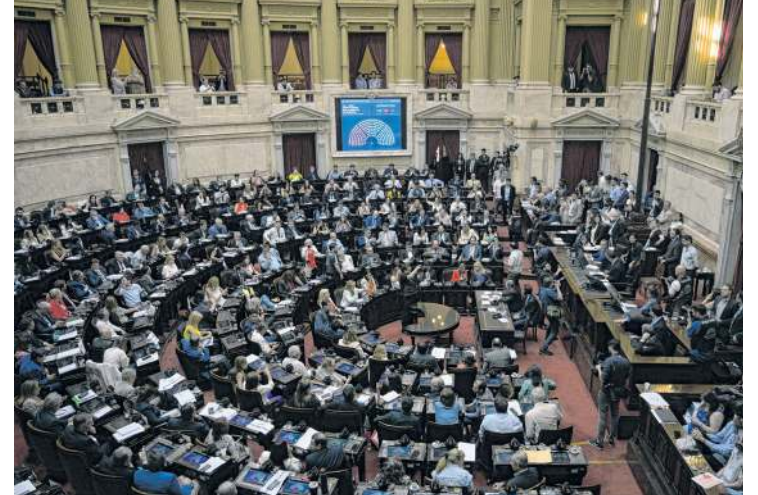
LEGISLADORES votaram as polémicas reformas ultraliberais de Milei

O projeto inclui a concessão de superpoderes, ou “poderes delegados”, a Milei para governar por decreto, dispor a venda de empresas públicas, contrair dívida externa sem aval parlamentar e desregular toda a atividade econômica, entre outras reformas de sua ideologia autodefinida como “anarcocapitalista”.