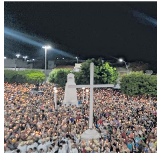
ROMARIA terminou com procissão