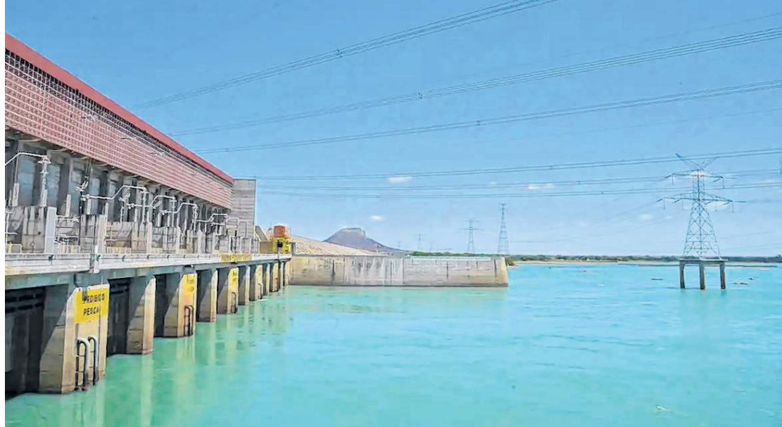
RESERVATÓRIOS do Nordeste devem finalizar fevereiro em alta

ARMANDO DE OLIVEIRA LIMA armando.lima@opovo.com.br