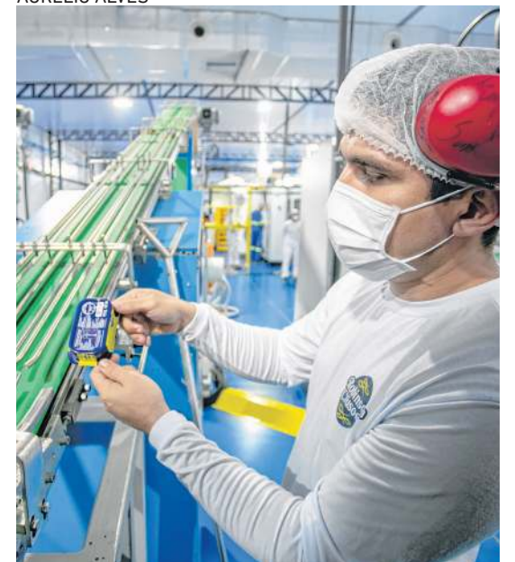
NOVE dos 25 ramos pesquisados registraram crescimento da produção