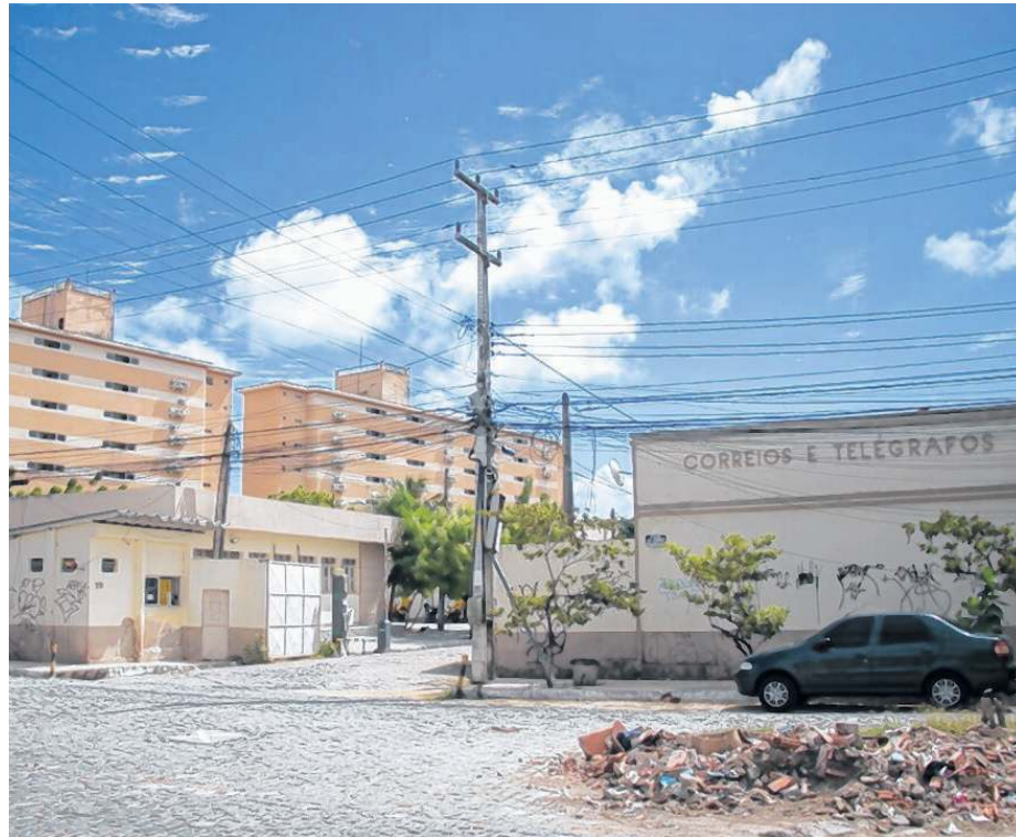
ÁREA dos Correios deverá integrar o novo Campus da UFC na Praia de Iracema