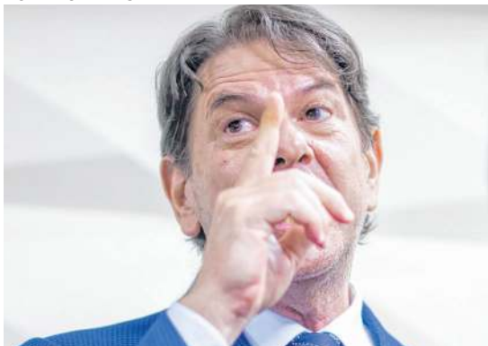
SENADOR Cid Gomes: trajetória conturbada