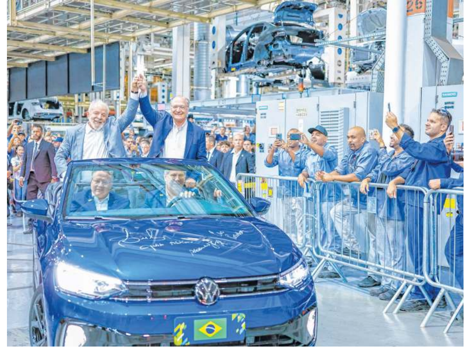
EM EVENTO com Lula e Alckmin, Volkswagen anuncia investimentos em fábricas no Brasil