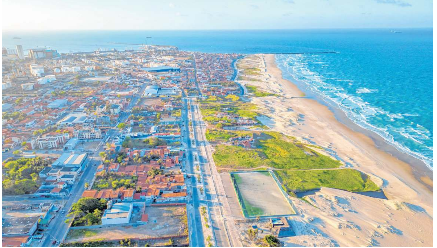
CÂMARA de captação da Dessal fica no limite entre o Vicente Pinzón e a Praia do Futuro